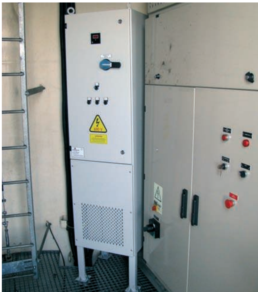
Fase de instalación

Este sistema dinámico con tiristores realiza una compensación en el punto de medida de alta tensión de la subestación eléctrica del parque mediante las consignas de un controlador ubicado en la propia subestación.