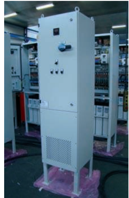
Fase de fabricación

EGÈTICA EXPOENERGÈTICA FERIA DE LAS ENERGÍAS