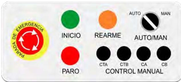
Figura 3 - Panel de mando

En primer lugar, se seleccionan los estados posibles en los cuales se puede encontrar el proceso. Lo primero es la seguridad por lo tanto siempre hay que programar la parada de emergencia D1. Se pide funcionamiento automático y manual (F1 y F4). Los cilindros son de doble efecto control biestable, por ello antes de iniciar la producción, el automatismo tiene que comprobar que los cilindros no están extendidos, recogiendo los si es necesario (A6). Por último queda seleccionar los estados inicial y parada pedida a final de ciclo (A1 y A2, respectivamente).