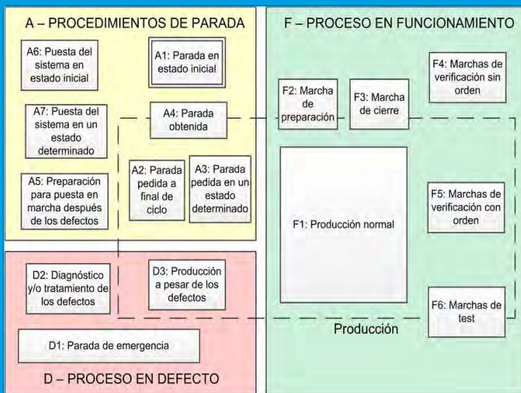
Figura 1 - Guía GEMMA

Antes de comenzar, el programador debe estudiar y entender la especificación del proceso. En este ejemplo el proceso tiene como objeto separar las piezas metálicas (grises) de las plásticas (amarillas). En la zona de detección (ZDP) se dispone de un sensor inductivo que detecta las piezas metálicas. Cuando se detecta una pieza metálica, el cilindro A se expande empujando la pieza hacia el radio de acción del cilindro B, que a continuación también la empuja hacia la segunda cinta transportadora (figura 2). Los cilindros son de doble efecto control biestable. En la especificación se requiere funcionamiento automático y manual.